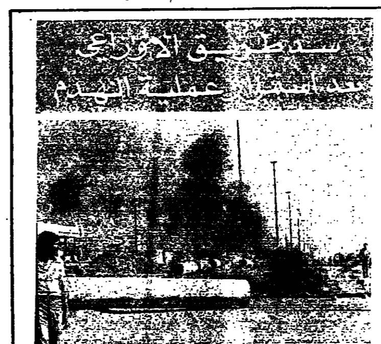
التار تصاعد من دواليب الكابوتوك التي اشعلها المظاهرات وسط الشارع في الأوزاعي امس

استقبلت قوى الجن امس، مدم البيوت التي اشعلت في اماكن الفخر خلال الاحداث الاخيرة، وشملت اجراءات الهدم ١٥ منزلا في منطقة الأوزاعي. وقد انسحبت قوى الجن بعد انجاز العملية، لنادي المواجهة مع اصحاب البيوت. وفي وقت لاحق نجح الاهالي على كورنيش الأوزاعي، واحضر اصحاب القاتل المهمة انتمهم الى الطريق العام، الذي سد في وجه السيارات بطائرات المظلات المشغلة وجحارة الباطون، طوال ساعتين. حدثت عن طول وانتقل القتي الجفري المنساز الشيخ تيلان، براضه الملامم اول سيف الى القنطة، وابلغ الاهالي ان عمليات الهدم الباقية قد ارجئت، وان البحث مستمر لانقاذ طحلول ايجابية، ويمكن انتظار هذه الطول من اللقطة التي شكلت لدرس القضية، والتبرخض مملئين عن السلطان واصحاب الارض والبيوت. البيعة على ص ١٤ عمود ٦ -